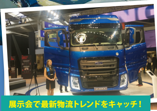
展示会で最新物流トレンドをキャッチ!