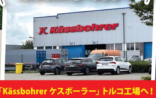
「Kässbohrer ケスボーラー」トルコ工場へ!